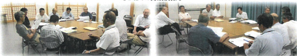
《 B班での討議模様 》